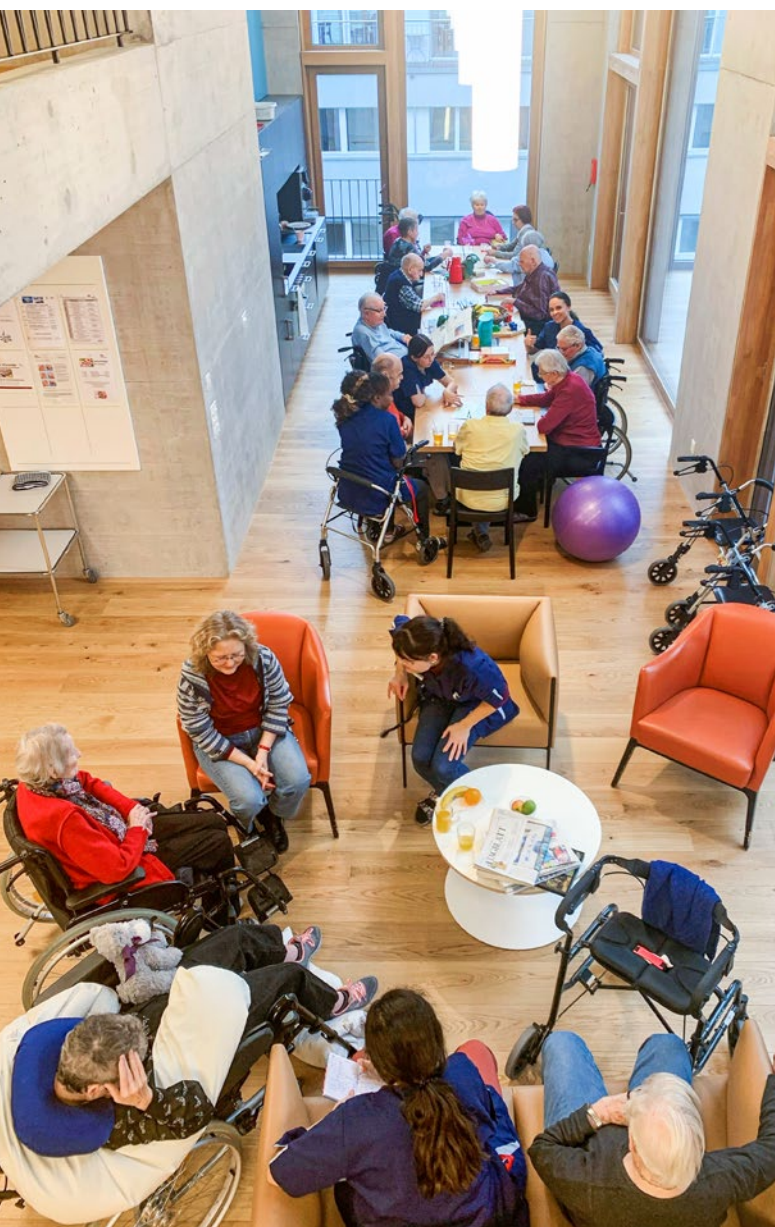
Grosszügige Aufenthaltsräume ermöglichen den Austausch und das gesellige Beisammensein.