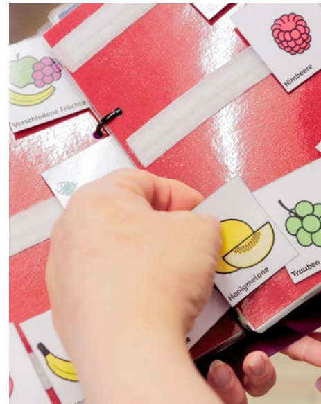
Symbole und Bilder unterstützen den Austausch und das Verständnis.